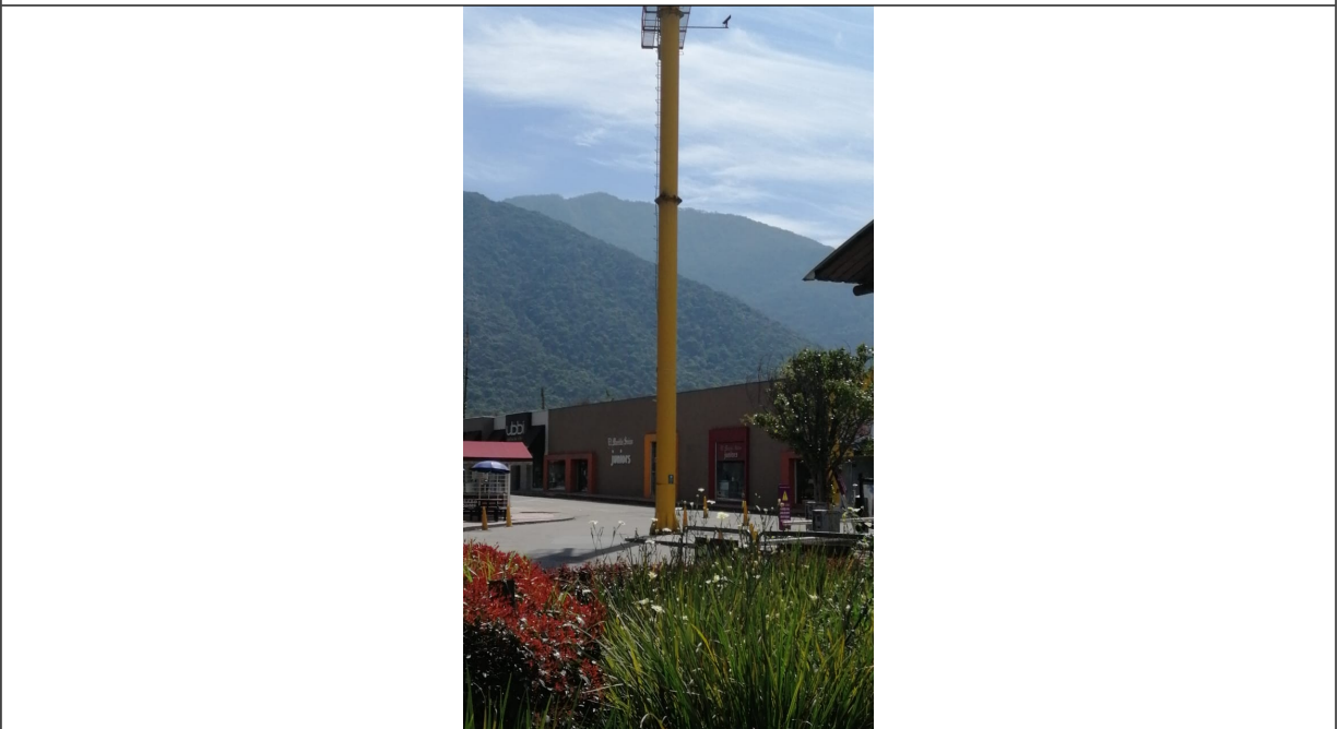
Foto 2. Detalles de la estructura tubular en buenas condiciones y estable