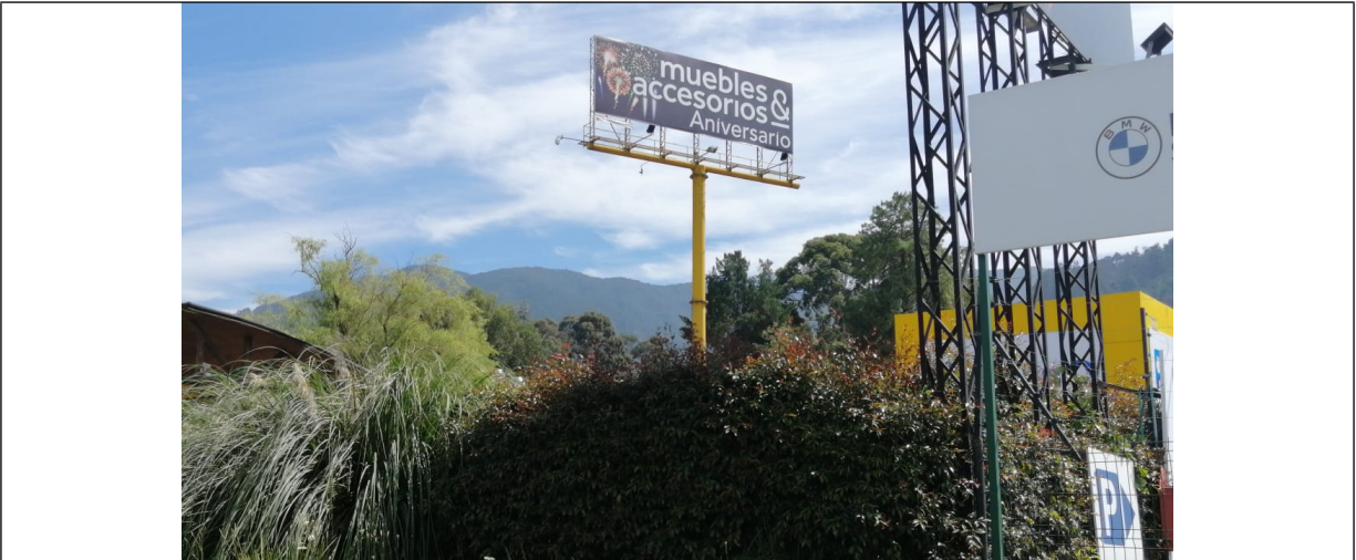
Foto No. 1 – Vista del panel y de la estructura de la valla ubicada en la Av. Carrera 45 No. 224-60 (dirección catastral) orientación Sur-Norte.